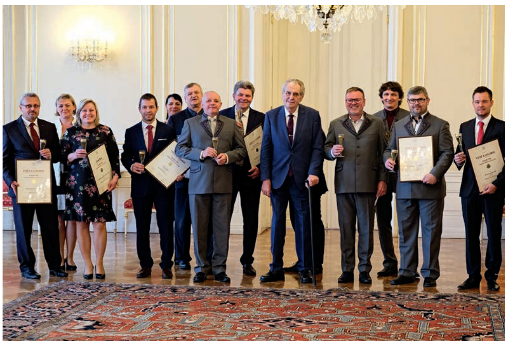
Přijetí u prezidenta republiky