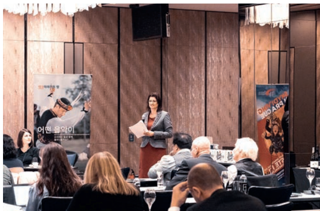
Discover Czech Specials – ilustrační foto