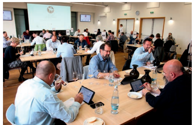
Hodnocení svatomartinských vín – ilustrační foto