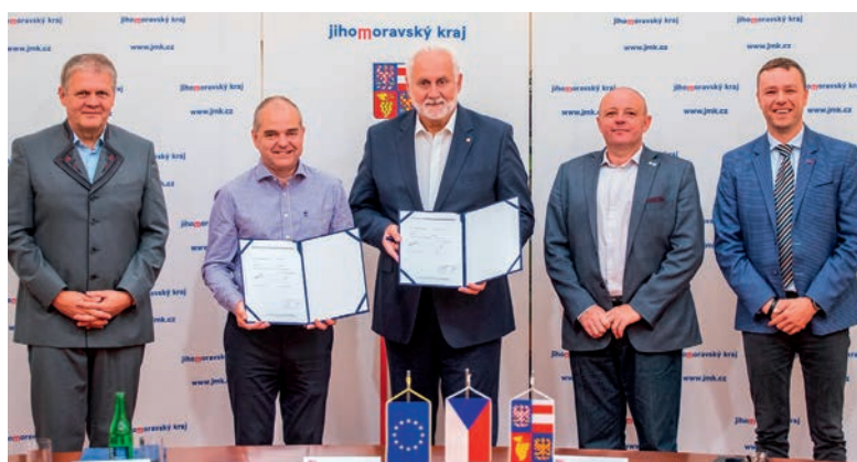
Podpis smlouvy o pořádání Concours Mondial de Bruxelles