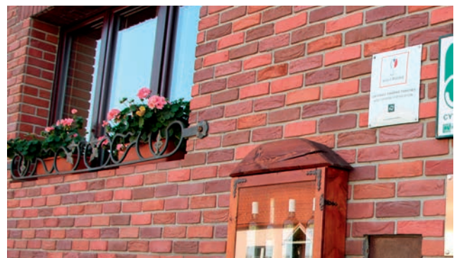
Certifikace vinařské turistiky