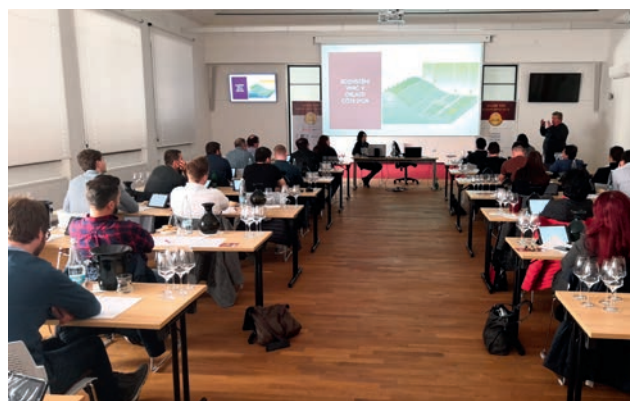
Školení zahraniční vína – Burgundsko