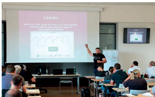
Školení Enologie v praxi