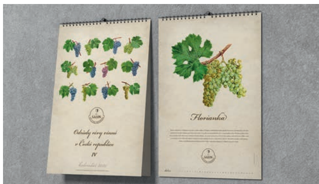
Kalendář odrůd pro rok 2020

Byla dokončena desátá etapa projektu certifikace objektů vinařské turistiky. Na konci roku 2019 jsme na 154 adresách registrovali 261 zařízení certifikovaných v kategorii vinařství (81), vinný sklep (88), vinotéka (33), restaurace (17) a vinařské ubytování (42). V roce 2019 bylo nově certifikováno na 9 adresách 16 zařízení v kategorii vinařství (5), vinný sklep (2), vinotéka (4), restaurace (2) a ubytování (3).