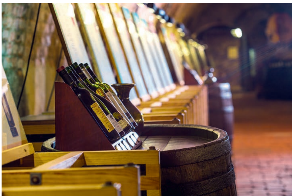
Salon vín ČR – ilustrační foto

Národní vinařské centrum sídlí v budově „Centrum Excellence“ ve Valticích, které jsou majetkem Jihomoravského kraje, jehož nákladem byla také budova v roce 2017 rekonstruována a dostavěna. Expozice Salonu vín je umístěna v historických sklepech Státního zámku ve Valticích, které byly zrekonstruovány za přispění Evropské unie a Ministerstva zemědělství ČR.