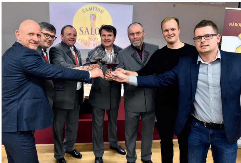
Salon vín ČR 2020 – finální kolo