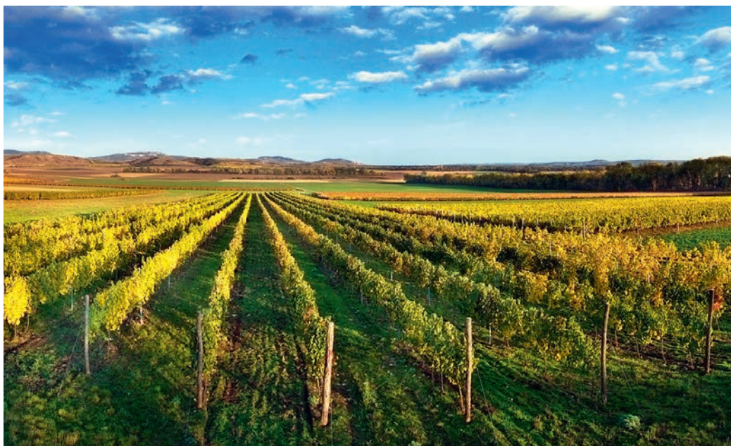
Vinice u Novosedel, vinařská podoblast Mikulovská